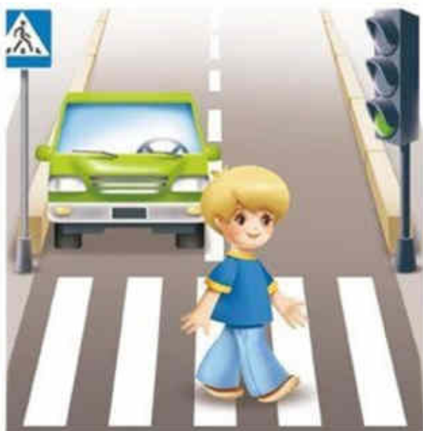
Переходить дорогу на зеленый сигнал светофора