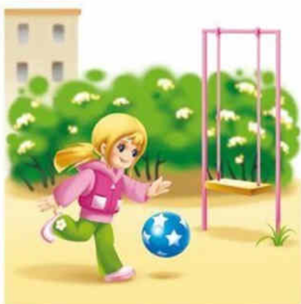
Играть в мяч на детской площадке