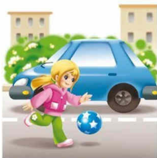
Играть в мяч на проезжей части