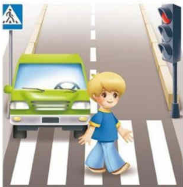
Переходить дорогу на красный сигнал светофора